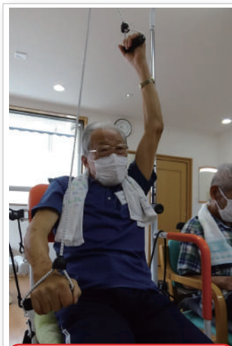
上半身の運動です。はい肩上げて～