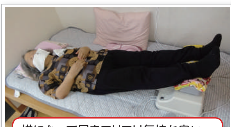
横になって足をフリフリ気持ちいい～