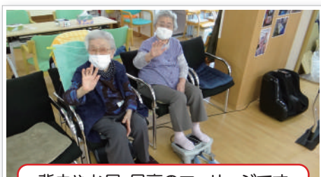
背中やお尻、足裏のマッサージです