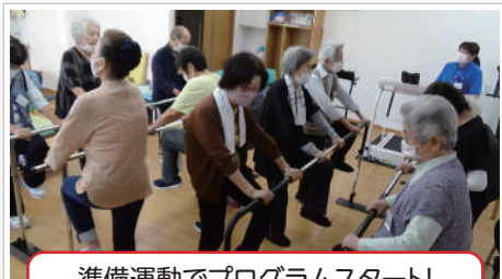
準備運動でプログラムスタート!

サバティ秦野南店オープン5カ月記念!!なんて記念日はあまり聞いたことありませんが、10月15日で5カ月が過ぎていきました。お陰様で利用者様も順調に増えていただいて、オープン当初は半日5人前後の利用者様でしたが、今では10人前後の利用者様に来ていただいています。利用者様には運動機器やマッサージ機器を中心に機能回復に励んでいただいています。「具体的にはどんなことやってんの」なんて思う方もいると思いますので一部ですが写真でご紹介させていただきます。