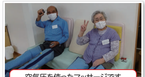
空気圧を使ったマッサージです