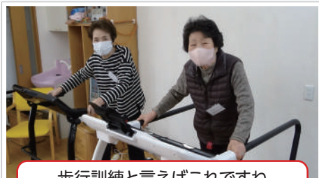
歩行訓練と言えばこれですね