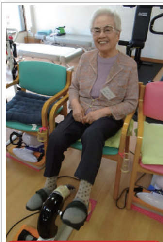
マシンがペダルを回しています