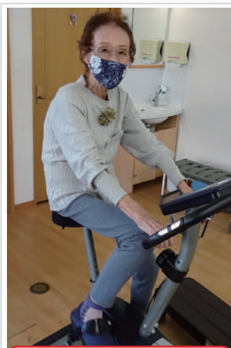
室内で安全サイクリングしてます