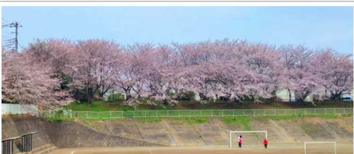
どこのグラウンドでしょう?