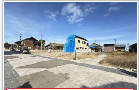
R7.11 朝市通り中程。解体されて更地に。