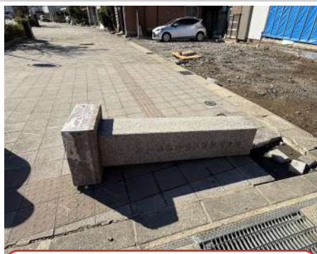
R6.11 朝市入口石柱が倒れていました。