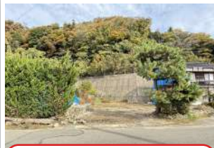
R7.11 倒れそうな民家は解体されて更地に