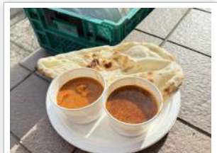
カレーとナンのセット