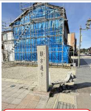
R7.11 石柱がしっかり立っています。