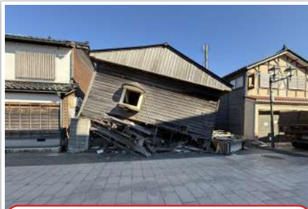
R6.11 朝市通り中程倒れそうだった