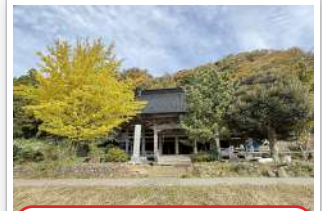
R7.11 お寺の周りがきれいに