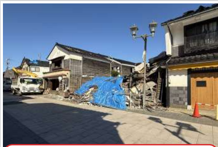
R6.11 朝市通り中程つぶれていました。