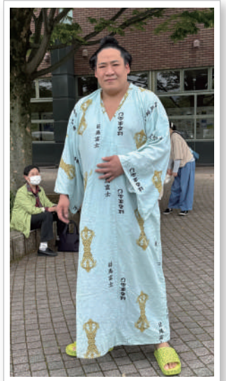
たまたま関取と遭遇！

サバティにはホームページがあるんです。秦野南店だけでなくその他の店舗の情報も満載です。スタッフのブログも掲載されていますので是非一度見に来てくださいね～。