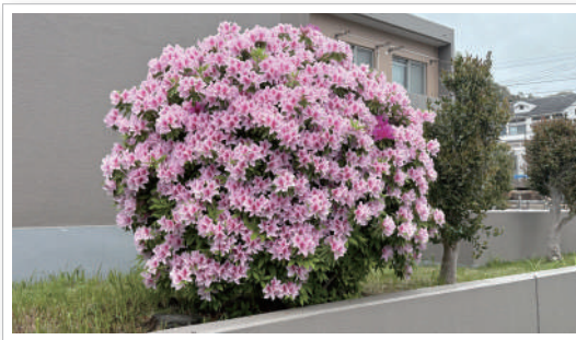
つつじも綺麗です