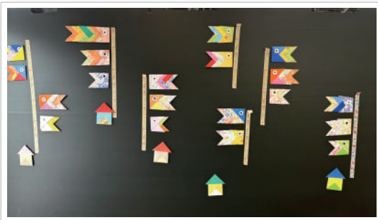
サバティにもこいのぼりが昇りました。 利用者様が折ってくれました！