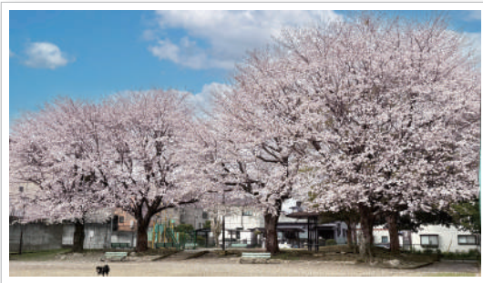
M.H.様のご自宅前の桜

もうすっかり、桜も散って、今は藤の花やつつじ、チューリップが綺麗に咲いていますね。 秦野市、市制70周年の記念に、相撲巡業『秦野場所』が4月25日にありました。なんと関取を見つけて写真を ゲットしました！今が一番いい季節ですね～。