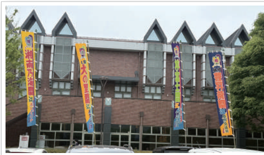
湘南乃海関・大の里関・尊富士関・豊昇龍関