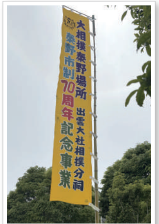
秦野市制70周年です！