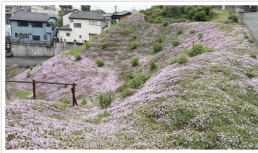
送迎の途中にこんな芝桜が咲いている場所が！