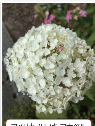
アメリカノリノキ アナベル