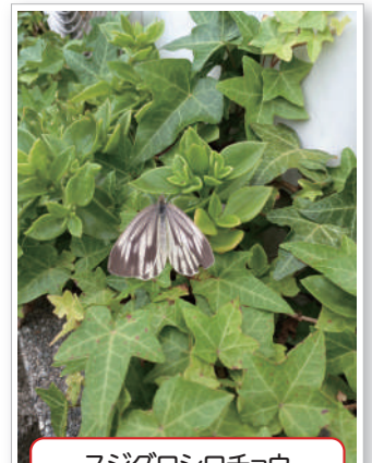
スジグロシロチョウ