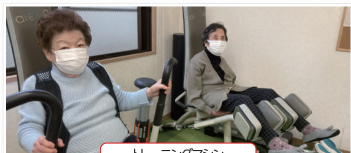
トレーニングマシン