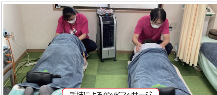
手技によるベッドマッサージ

メドマー (空気圧を利用した波動型の医療用マッサージ器) 干渉波治療 (痛みのある部位や筋肉が硬い部分に対する「マッサージ効果」「血行促進効果」「鎮痛効果」があります。)