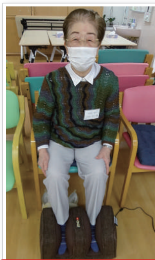
いつもニコニコ、最高です