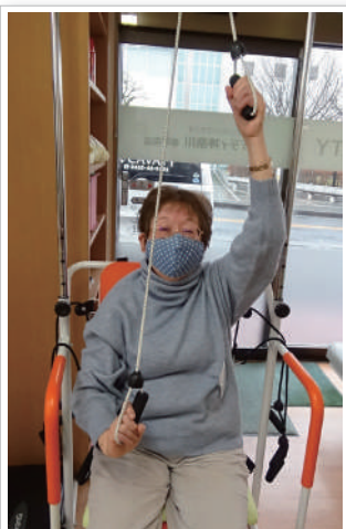
この力強さ本物ですね