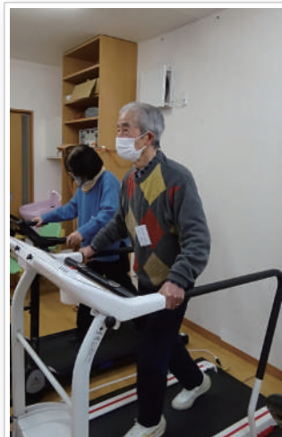
実は、テレビに夢中なんですよ〜