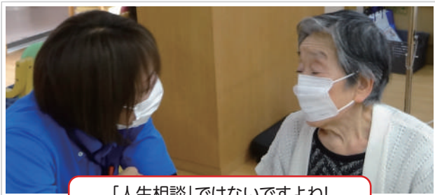
「人生相談」ではないですよ!