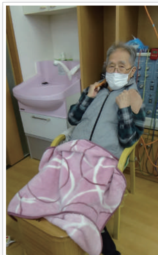
電気と足湯を同時にやると、そこは別世界