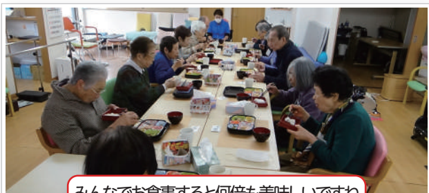
みんなで食事すると何倍も美味しいですね