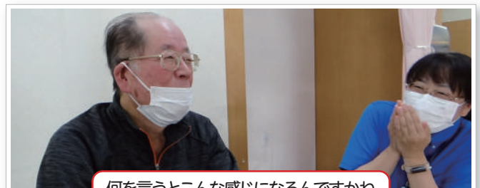
何を言うとこんな感じになるんですかね

サバティにはホームページがあるんです。秦野南店だけではなくその他の店舗の情報も満載です。スタッフのブログも掲載されていますので是非一度見にきてくださいね〜。