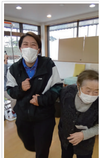
手引きになっていませんが…