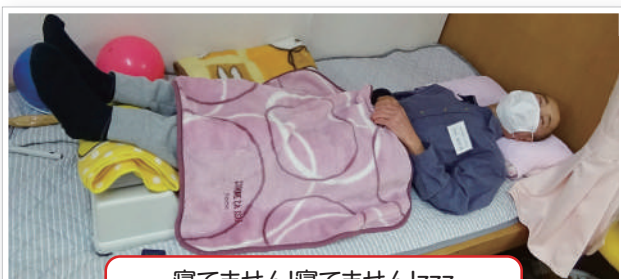
寝てません!寝てません!zzz