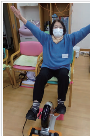
とと、飛ぶんですか!!