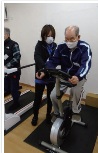
今日は何メートル走れそうですか〜