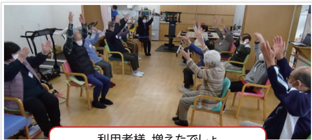
利用者様、増えたでしょ