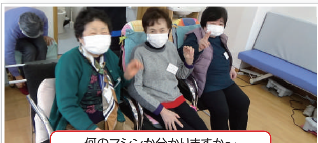
何のマシンが分かりますか～