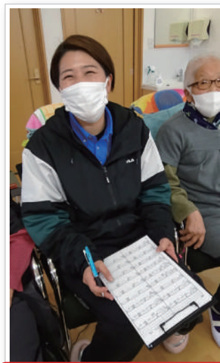
ちゃんと記録も付けてますよ～