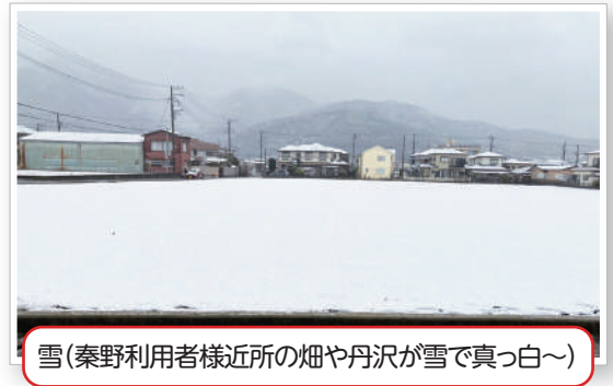
雪(秦野利用者様近所の畑や丹沢が雪で真っ白～)

降り始めた雪が気になり落ち着かない利用者様…「綺麗だねえ」「帰れるかな?」様々な言葉が飛び交う中、常に天気予報を確認しながら利用者様の不安を取り除くことに必死な一日でした! もう雪は勘弁です(°Д°)