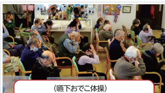
(嚥下おでこ体操) しっかりおでこに手を当てて～

そして体力が低下すると飲み込む力も衰えるとのことですので！！適度な全身運動で飲み込む力 を維持しましょう！！