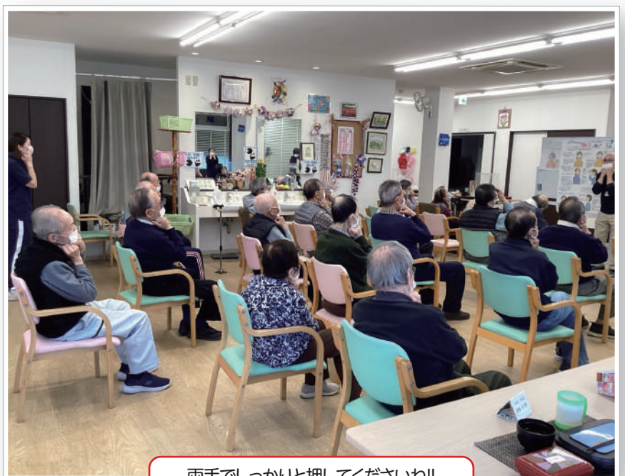
両手でしっかりと押しくださいね!!