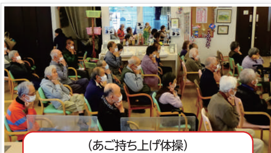
(あご持ち上げ体操) あご押ししてくださいね!!