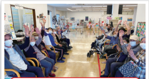
帰りの玄関で...何でしょう?

サバティにはホームページがあるんです。秦野南店だけでなくその他の店舗の情報も満載です。スタッフのブログも掲載されていますので是非一度見にきてください。