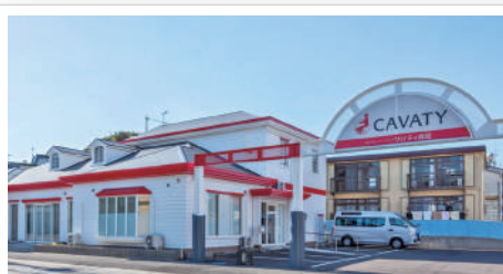
外観です。立派でしょ。