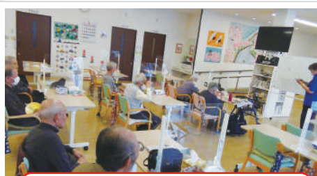
脳トレやって頭をフル回転