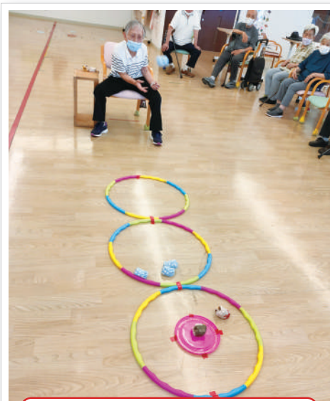
レクリエーション、みんな燃えています!