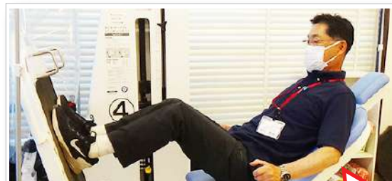
ドライバーさんも頑張ってます。