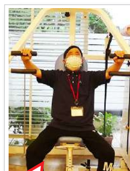
目線気を付けないと…