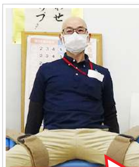
股関節柔らかいですね!

スタッフ全員、笑顔を忘れず元気に利用者様へサービス提供するため、日々様々な工夫をしています。