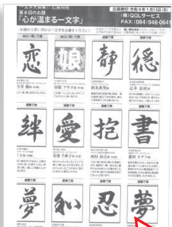
月刊デイに掲載されました。