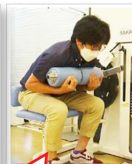
背筋の意識忘れずに!