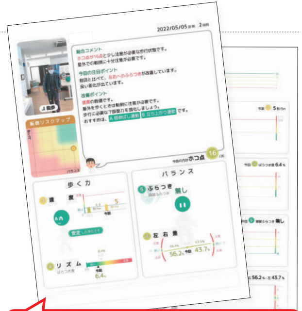
分析結果(コミュニケーションシート)

二回目測定の結果では、殆どの利用者様の注目ポイントが「左右へのふらつきが改善しています。」や「歩行リズムが良くなっています。」と歩行状態が良くなっているコメントが出ています。撮影を意識され歩行時の姿勢も良くなっている様です(笑)