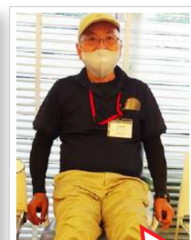
ドライバーさん上手です