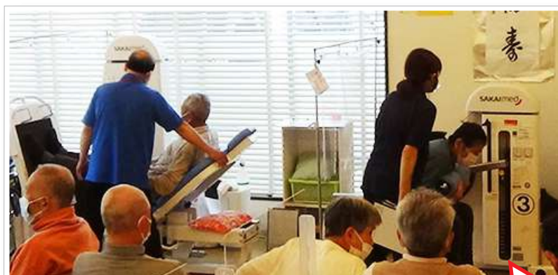
ゆっくり動かしてくださいね!