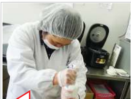
生クリーム上手く絞れてますねえ

「わあ〜美味しそう〜」「綺麗!」お配りしている時の利用者様の何とも言えない満面の笑み!スタッフも食べた〜い(笑)