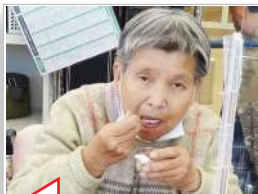
お味はいかがでしょうか?