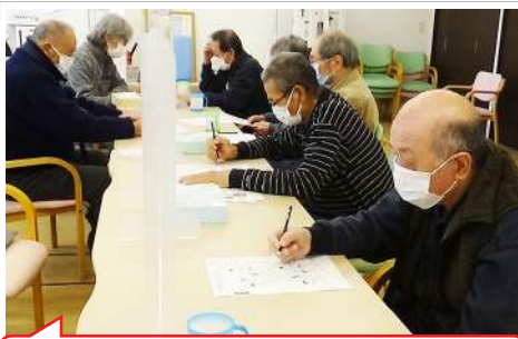
将棋より間違い探しのが…