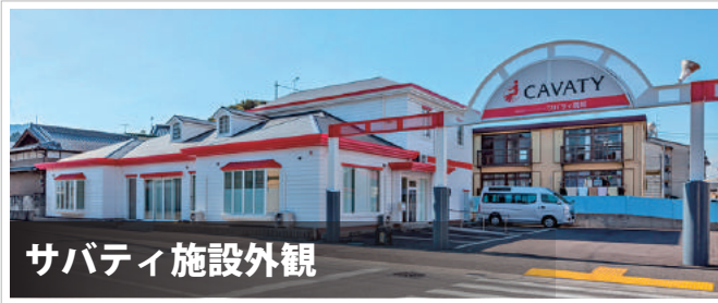
サバティ施設外観