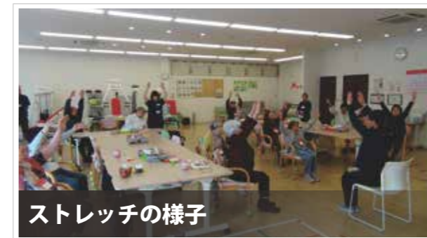
ストレッチの様子

数年前から、両膝や腰が痛くて歩くのも嫌になっていました。気持ちも沈んでしまってどうしても無かった時期にサバティに通うようになって、気持ちが明るくなりました。軽い重さの運動なので、体も痛く無く安心です。気持ちが前向きになると体も以前よりは良くなったように感じます。今ではサバティに来ることが一番楽しみです。