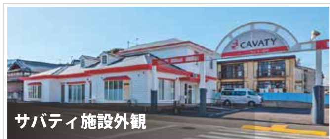
サバティ施設外観