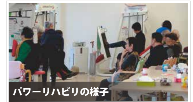
パワーリハビリの様子