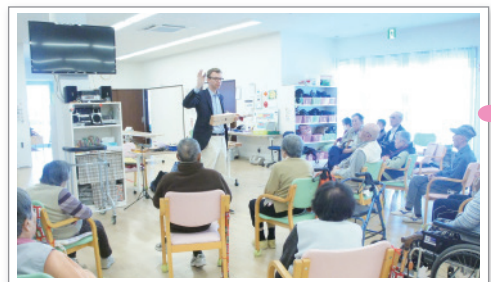
講師をお招きして本格的ブンネメソッドを実施！

目標は、ブンネ楽器を使い歌や演奏をすることにより、 記憶トレ ーニングや、発声能力の改善 を図ります。またグループで行う為、 社会的な能力が刺激 され、「明るくなった」という効果もあります。 楽器も片麻痺の方でも演奏できるように考慮された特製のものを 使用し、どなたでも「楽しく」「効果のある」音楽を実感して いただけます。