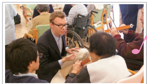
みんなでブンネ楽器を体験してみましたよ！